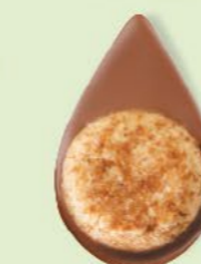
BISCUIT NOISETTES Chocolat au lait 35% de cacao