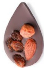
JULIETTE IN THE CITY Chocolat noir 70% de cacao, amande, noisette, raisins secs