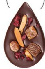
JULIETTE & TOM Chocolat noir 60% de cacao, dés d'abricots secs, amandes caramélisées et morceaux de cerise