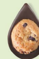
BISCUIT CRANBERRIES Chocolat noir 60% de cacao