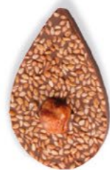
GRAINE DE JULIETTE Chocolat au lait 35% de cacao, sésame, noisette caramélisée