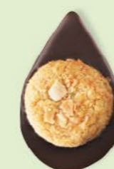
BISCUIT AMANDES Chocolat noir 60% de cacao