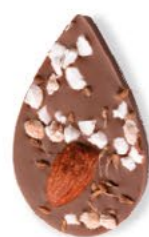
LE SONGE DE JULIETTE Chocolat au lait 35% de cacao, amande, éclats de nougat, brins d'anis