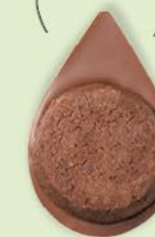
BISCUIT BROWNIE Chocolat au lait 35% de cacao